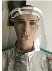
Viseira Hospitalar c/ Adaptador