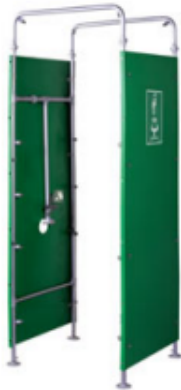
Cabine Descontaminação HAWS

2) Evite que o vírus entre nas instalações, utilize tapetes desinfetantes, cabines de desinfecção e cobre sapatos.