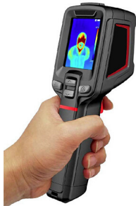
Câmara Termográfica Portátil

1) Verifique se alguém tem febre à entrada e saída das instalações, utilize termómetros, câmara portáteis ou fixas.