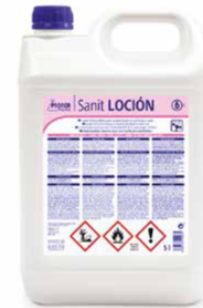
Gel de mãos 5L

A função do álcool gel é reduzir a quantidade de microorganismos, ajudando no combate a doenças, no entanto, se as mãos estiverem visivelmente sujas é recomendado que a lavagem seja feita com água e sabão.