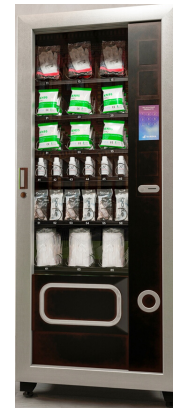
Máquina dispensadora de EPI'S

Controle e poupe ao disponibilizar EPI's, ferramentas, consumíveis industriais, consumíveis de escritório e outros equipamentos aos seus funcionários em qualquer turno de trabalho, através de uma Máquina Dispensadora de EPI's .