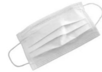
Máscara Comunitária em tecido

“A utilização de EPI's não dispensa o cumprimento das Precauções Básicas de Controle de Infecção e de outras medidas entre as quais a etiqueta respiratória e o distanciamento social.” Direção-Geral da Saúde (DGS)