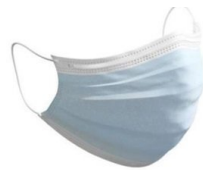
Máscara Cirúrgica Tipo II