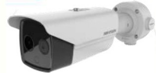
Câmara Termográfica Fixa Com Gravação em HDD