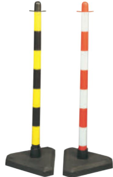
Postes de alerta