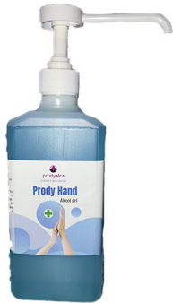
Gel de mãos c/ doseador 500ML

c. Gel desinfetante: Embalagens individuais de 200ml, de 500 ml e 1 litro com doseador para encher, bem como garrafões de 5 litros.