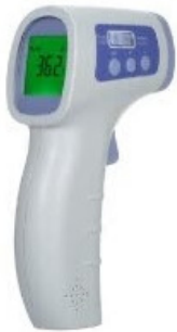
Termómetro Digital TD133